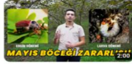
Mayıs Böceği Zararlısı ve Mücadele Yöntemleri 2:00