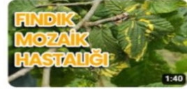
Fındık Mozaik Hastalığı 1:40