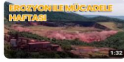
Erezyon İle Mücadele Haftası 1:32