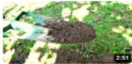
Fındık Bahçesinden Toprak Örneği Alınışı! 2:51